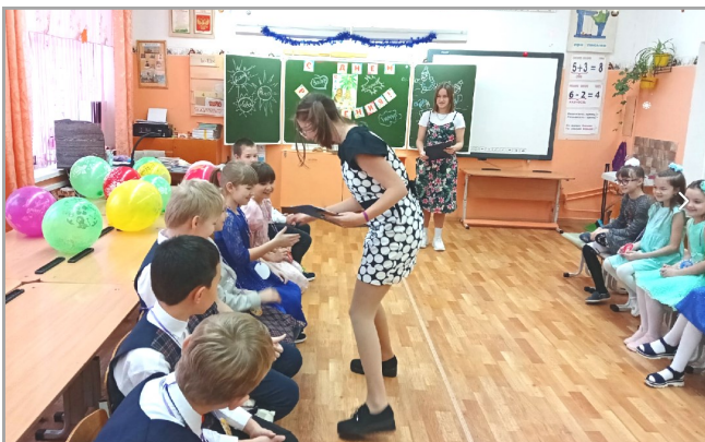
Учащиеся 3 класса

Мы сами, без мам, в кафе "Сладкоежка" накрыли замечательный праздничный "чаепитный" стол! А потом (представляете?) САМИ всё прибрали и даже посуду вымыли!!! Повзрослели, что ли? Конечно!!! На целый год повзрослели!!!