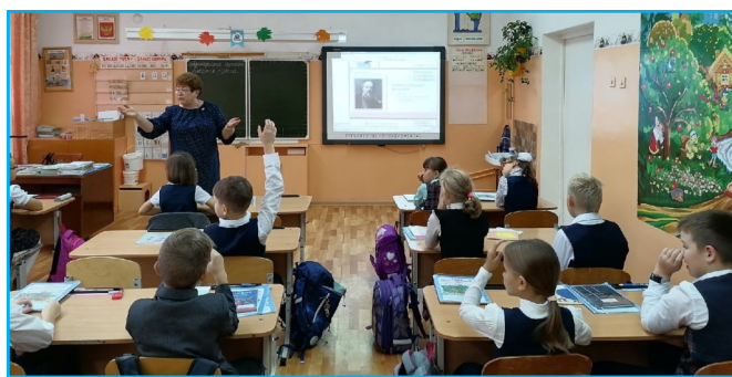
«Разговоры о важном» в 4 классе